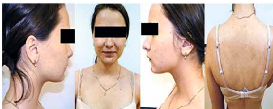
До начала лечения