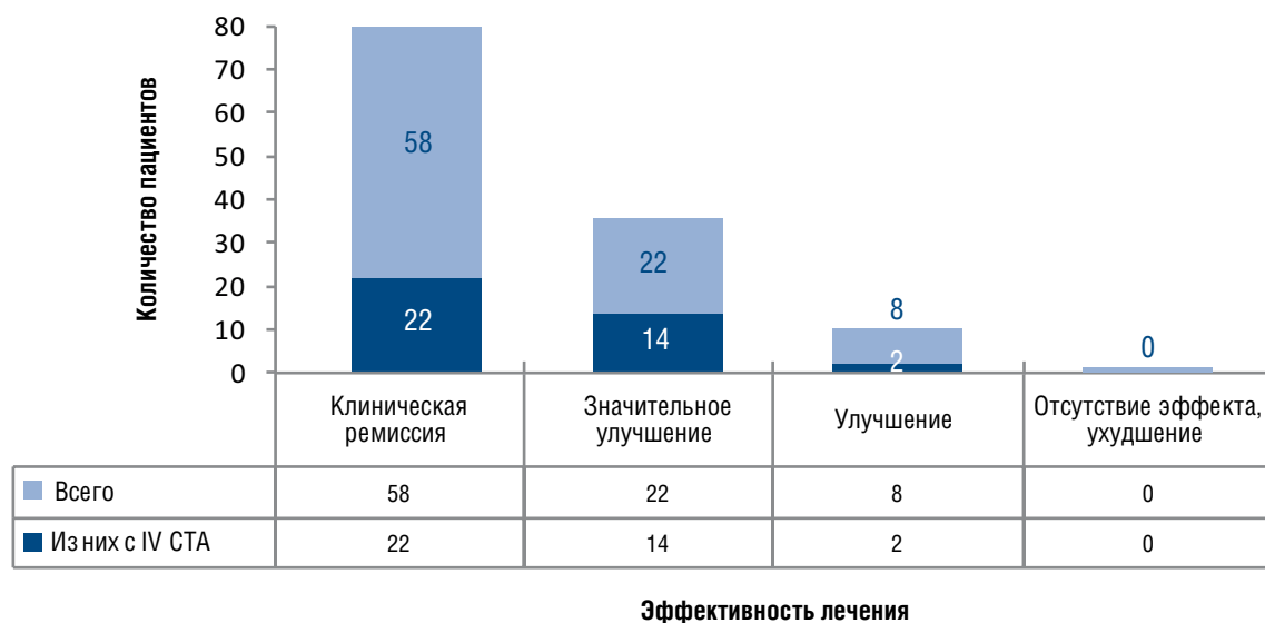
Рис. 4. Результаты лечения Акнекутаном (n = 88)

яичников — у 26 (46,4%), хронический сальпингит — у 21 (37,5%) и вульвовагинит — у 18 (32,1%), а также диффузная фиброзно-кистозная мастопатия — у 6 (10,7%). Мастодиния, или масталгия, в предменструальном периоде регистрировалась у 43 (76,8%) больных, утолщение эндометрия в полости матки — у (9) 16,1%, гипоплазия матки — у 7,1% (n = 4). У 30 (53,6%) пациенток наблюдалось сочетание двух и более заболеваний репродуктивной системы.